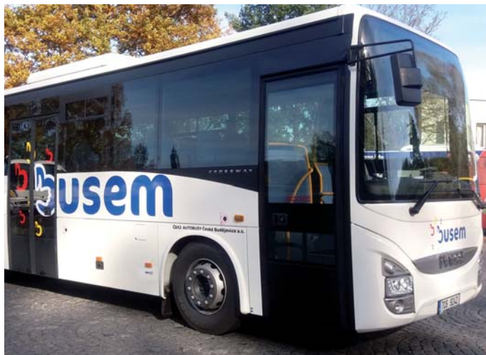
Nový autobus Crossway

Firma tím potvrzuje svůj zájem poskytovat cestujícím služby na velmi slušné úrovni a dál je rozvíjet. Už letos proto byla nová vozidla do 13 metrů svou výbavou „povyšena“. Proti standardu mají i dvojitě boční zasklení včetně dveří, výkonnou klimatizaci zhruba 34 kW, vyšší a sklopné sedačky pro cestující. K dispozici