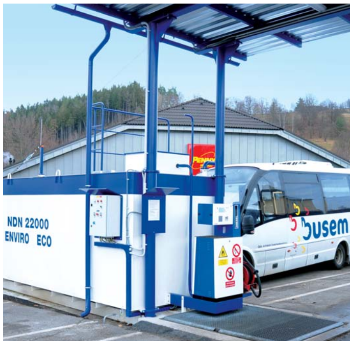
Neveřejná čerpací stanice na vimperkém autobusovém nádraží.

V závěru roku 2014 byla v areálu autobusového nádraží ve Vimperku uvedena do provozu neveřejná čerpací stanice, s níž jsou dosud velmi dobré zkušenosti. Návratnost investice potrvá zhruba 4 roky. Stavba čerpací stanice je ale pouze součástí dalších možných změn v areálu zdejšího autobusového nádraží. Už před několika lety společnost ČSAD AUTOBUSY České Budějovice přikoupila sousední pozemek od města, který byl při stavbě čerpací stanice k areálu nádraží stavebně připojen a využívá se jako parkoviště pro autobusy. Tento prostor plně nahradil úbytek parkovacích míst, která ustoupila čerpací stanici. S tím souvisela i změna v přístupu chodců do areálu z jednoho směru, zajišťující