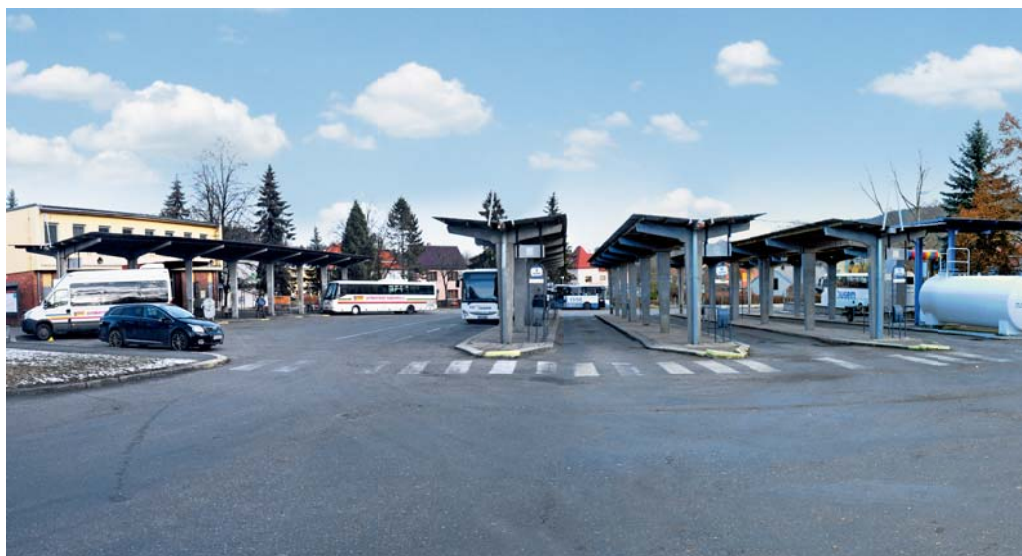
Zachováno bude současné šikmé stání u budovy a první průjezdné nástupiště od ní. Obě budou zvětšena pro 12 odjezdových míst. Ostatní nástupiště směrem k čerpací stanici se zruší.

Systém vjezdu a výjezdu se nezmění. Vjezd z Nádražní ulice bude zachován a nebude rozšířen o výjezd, který zůstane i nadále směřován do Nebahovské ulice.