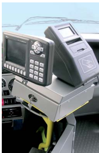
Nové odbavovací strojí

Systém nabídne současně uznávaný tarif - platbu za ujeté kilometry. Jedná se i o zavěšení období v minulosti používaných „týdenek“. Tedy jízdenek, které budou cenově