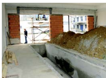
Přestavba opravárenských dílen v Písku

uzavření prostoru mohlo dojít maximálně na několik dnů.