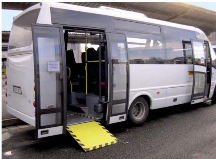
Nízkokapacitní vozidla Rošero First

„K plánování dopravy využíváme počítačové programy, které umí vyhodnocovat špičkovou obsazenost jednotlivých turnusů. Tedy denních vzorových plánů jednotlivých autobusů. To pak pomáhá určit optimální nasazení vozového parku,“ vysvětluje Karel Coufal. V úvahu se ale při hodnocení berou i mimořádné odchylky v obsazenosti, vázané na jednotlivé pracovní dny, podobně jako rozdílné potřeby, dané střídavým nasazením provozů velkých zaměstnavatelů v regionu na liché a sudé týdny. Na Kaplicku tak bude při respektování tohoto trendu nasazeno až 6 vozidel této kategorie a až 9 autobusů dlouhých 9,5 metru z celkem 20 vozů.