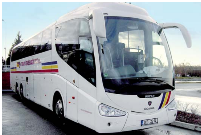
Dálkový autobus SCANIA ve flotile ČSAD AUTOBUSY České Budějovice

Jde o další vsířicný krok vůči zákazníkům, kterým společnost ČSAD AUTOBUSY České Budějovice zlepšuje úroveň dopravních služeb.