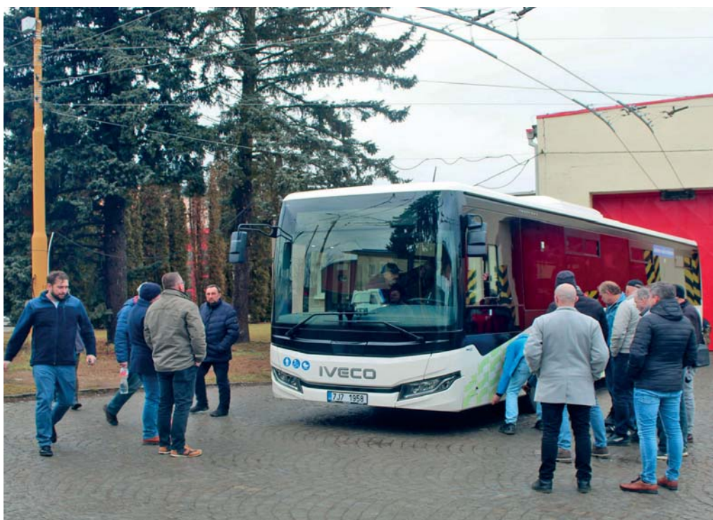
Poznat značku Busem přišly na „otevřený den“ v Jihlavě desítky potenciálních zaměstnanců a dalších lidí.

běžného cestujícího není co vytknout. Pokud bude mít v rukou volant zkušený řidič, pak bude jízda těmito vozidly skvělou volbou pro cestování do škol, do práce, za sportem nebo za zábavou. Přeji tedy cestujícím, využívajícím Veřejnou dopravu Vysočiny, ale i týmu dopravce Busem, mnoho šťastných kilometrů.