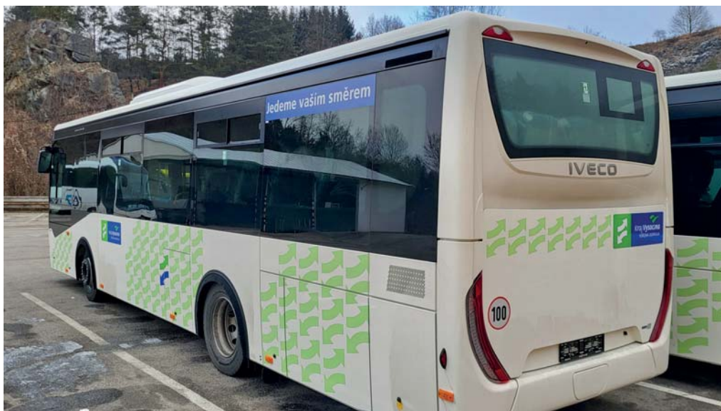
V barvách kraje. Autobusy Busem jsou podle smluvních přepravních podmínek označeny polepy VDV (Veřejná doprava Vysočiny).

autobusů u místních partnerů, zejména u Dopravního podniku města Jihlava.