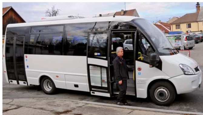
Mikrobus Iveco Rošero

tické a vodácké akce, vysoko-horskou turistiku i expedice, ale i školní zájezdy, exkurze a výlety v tuzemsku i Evropě a to různými typy autobusů. Od těch pro krátké vzdálenosti a s nižším nárokem na komfort, jako jsou Karosa a SOR, přes mikrobuse Iveco Rošero - P využívané k přepravě do 20 osob, až po luxusní zájezdové vozy Setra, Scania a Bova. Novinkou vozového parku se letos stal luxusní, čtrnáctimetrový Neoplan 1218 HDL pro 60 osob.