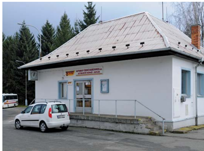
Správní budova na kaplickém nádraží před demolicí.

„Momentálně probíhají přípravy na zahájení této stavební akce. Musíme vytvořit provizorní provozní zázemí v buňkách na sousedním pozemku, který