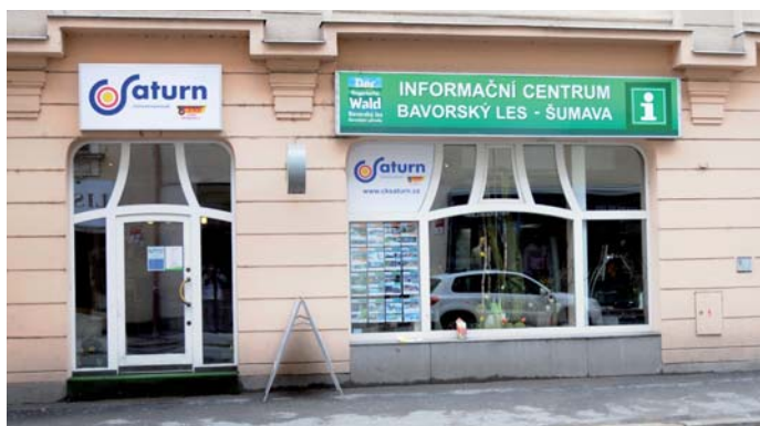
Nová kancelář v českbudějovické ulici Karla IV.

lupracovali už dříve a zájezdy a výlety do Bavorska jsme měli v nabídce, ale nyní přibývají nové produkty jako je turistika po Bavorském lese nebo golfová turistika. Čas ukáže, o jaké služby bude zájem a jak naše podnikání rozšíříme.