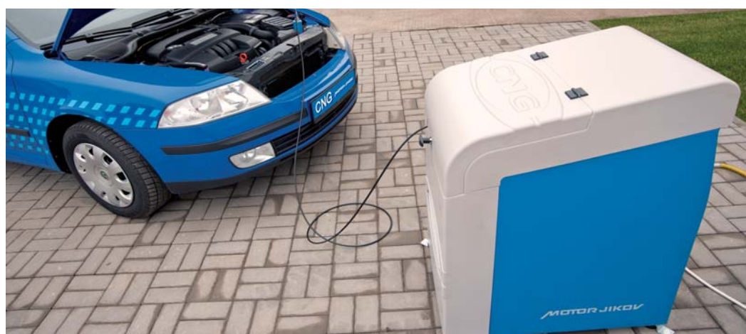
Malé plničky CNG z Motoru Jikov Strojírenská jsou velké jako lednička. Uplatní se v domácnostech nebo u živnostníků.

Vybudování plnicí stanice připravuje v areálu autobusového depa na Chvalšinské ulici, které leží u hlavního silničního tahu směrem na Lipno a Černou v Pošumaví, společnost MOTOR JIKOV Strojírenská a Zliner Energy. Tankovat v ní budou moci 24 hodin denně nejen řidiči autobusů, ale i osobních, nákladních nebo dodávkových vozidel. Do provozu by měla být uvedena ve druhé polovině letošního roku.