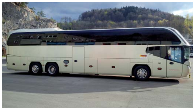
Vozový park firmy rozšířil také nový autobus Neoplan.

je, když se čas od času domluví na společném výletě i lidé v práci. I ti morousové jsou najednou zábavní. Prostě společné zážitky dělají divy.