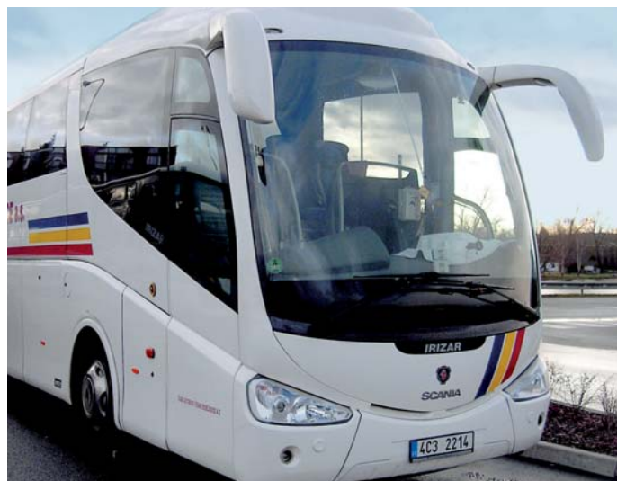
Z Českého Krumlova do Prahy a zpět se lze dostat třikrát denně.

„Prodloužení linky bylo logickým vyústěním provozu na původní trase pouze do Českých Budějovic. Dosud jsme totiž